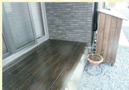
お客様のDIYで素敵なウッドデッキが完成していました。隣に見える室外機カバーもお手製。脱帽です。