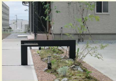
玄関までのアプローチに植栽を配して夜はライトアップも。おしゃれな家に帰るのが毎日楽しくなりそう。