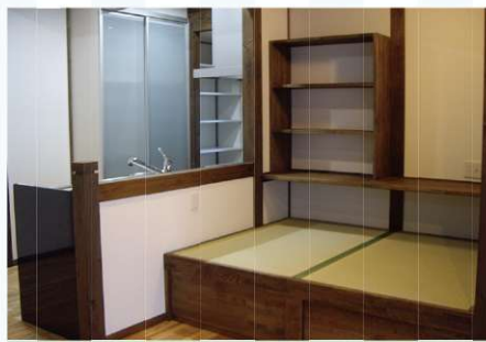
ダイニングに小上がりスペースを設けました。食卓用の椅子も兼ねている上、プチ書斎コーナーにも。