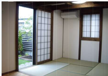
和の佇まいをご希望のお施主様。畳コーナーに内障子を備え付け外には癒しの庭が。