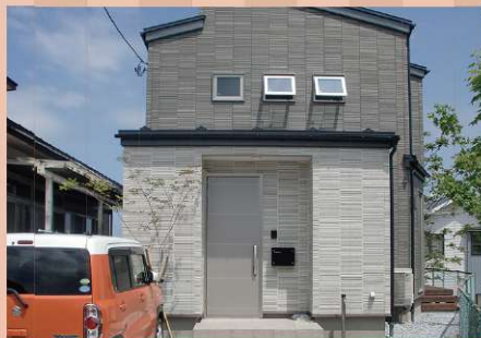
高性能な外装材にこだわった外観。アクセントの窓とモノトーンな配色がシンプルモダン