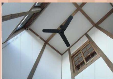
吹抜には格子のおしゃれなデザイン窓。シーリングファンは airflow が2通り、夏冬で使い分けができます。