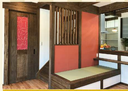
和モダンな佇まい。朱色の壁と畳ベンチのもえぎ色が映えます。