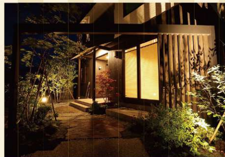
まるで格式ある料亭を思わせるかのようなアプローチ。美しすぎます。